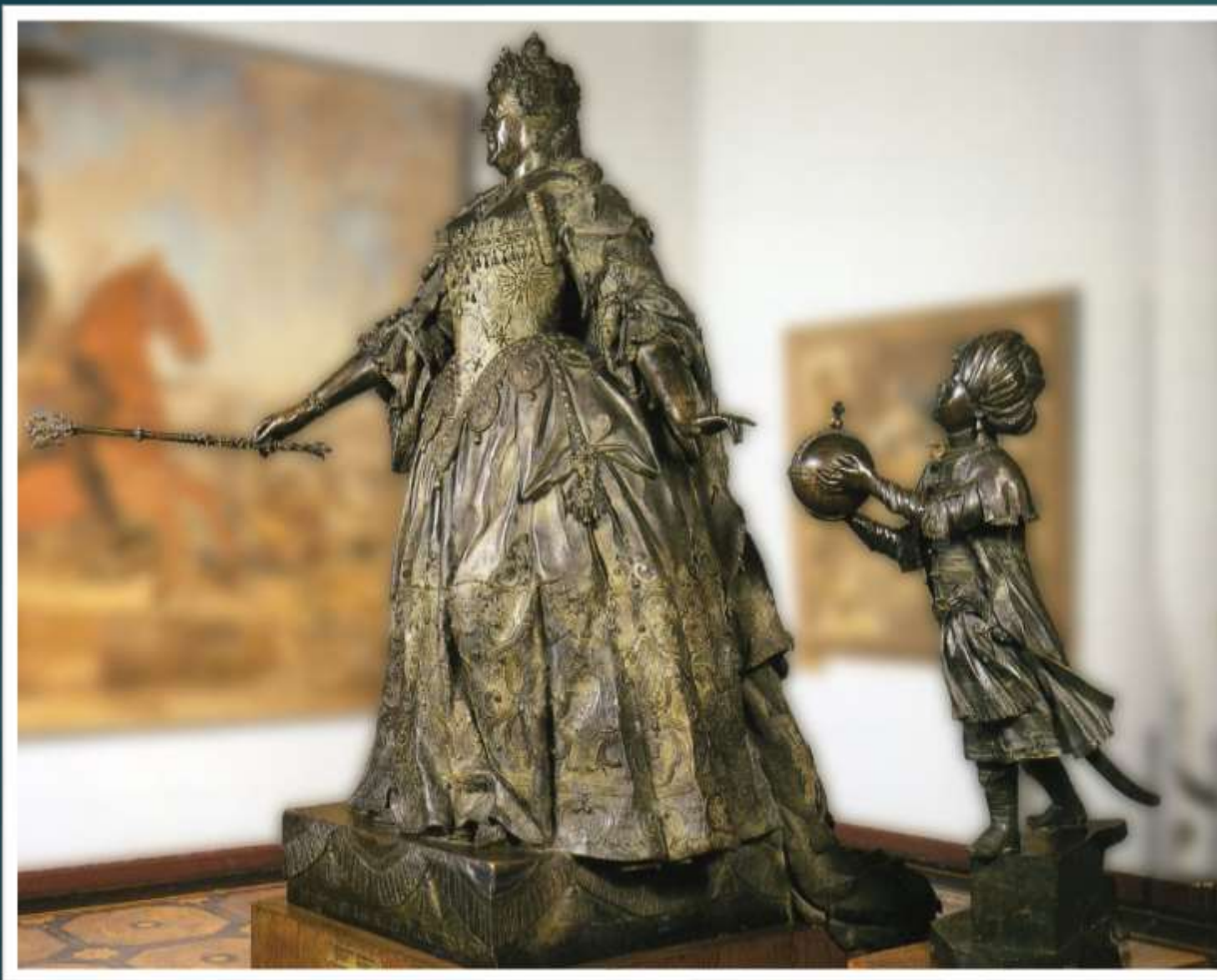
▶ РАСТРЕЛЛИ Бартоломео Карло ▶ Скульптура. Анна Иоанновна с арапчиком. 1741.