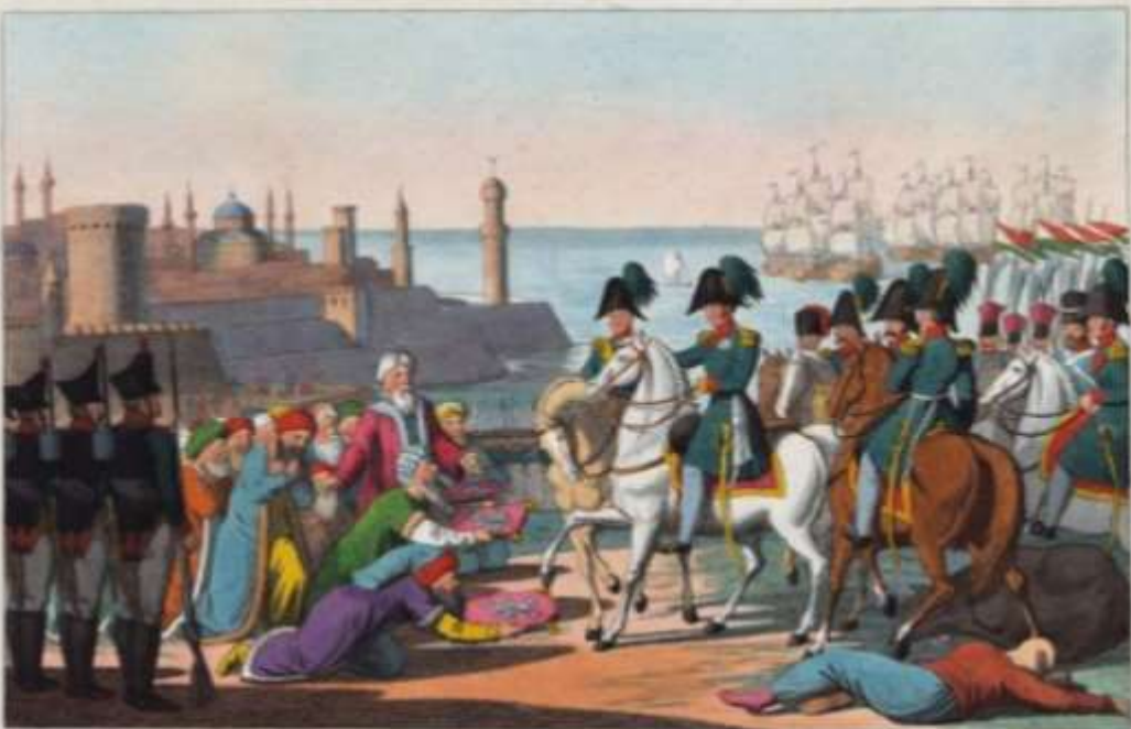
Übergabe der Festung Varna am 11 October 1828.

Klein eine lange, vollkommene Belagerung, an Bräuwerk und Spießwerk, Belagerung, Muth und Anhalten der Belagerer, sich allmählich herbeizuführen, und endlich ein klein Stück Muth im Handwinken herbeizuführen, unter Führung des kaiserlichen Feldmarschalls, am 11 October im Tageslicht durch die Besatzung dem Russen übergeben und in der Festung übergeben, wurde die türkische Besatzung, unter Ibrahim Pascha, die von 10,000 Mann auf 6,000 Mann zurückgelassen war, gezwungen, sich nach Belgrad nach und Varna zu begeben. Eine Capitulation überbrachte dem Kaiser Nikolaus, welche die Uebergabe der Festung, der Stadt, und der Belagerer, — der Belagerer, und für die Belagerer, welche am 11 October, — und endlich die Besatzung, unter Ibrahim Pascha, die von 10,000 Mann auf 6,000 Mann zurückgelassen war, gezwungen, sich nach Belgrad nach und Varna zu begeben.