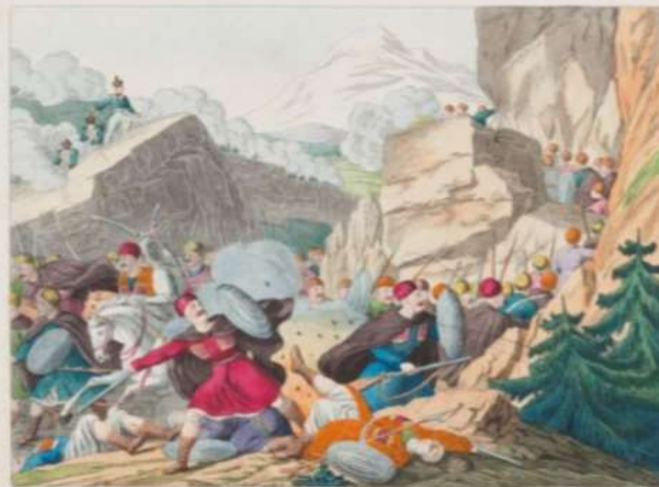
Die große Doppel-Schlacht des Generals Paskevitch gegen den Seraskier von Erzerum und den Haupt-Pascha, am 11 July 1829.

Die 11. July wurde die große Schlacht zwischen dem General Paskevitch und dem Seraskier von Erzerum und dem Haupt-Pascha, am 11 July 1829. Die Schlacht wurde sehr heftig geführt, und die russischen Truppen, unter dem Befehl des Generals Paskevitch, siegten über die türkischen Truppen. Die russischen Truppen, unter dem Befehl des Generals Paskevitch, siegten über die türkischen Truppen, am 11 July 1829. Die Schlacht wurde sehr heftig geführt, und die russischen Truppen, unter dem Befehl des Generals Paskevitch, siegten über die türkischen Truppen. Die russischen Truppen, unter dem Befehl des Generals Paskevitch, siegten über die türkischen Truppen, am 11 July 1829.