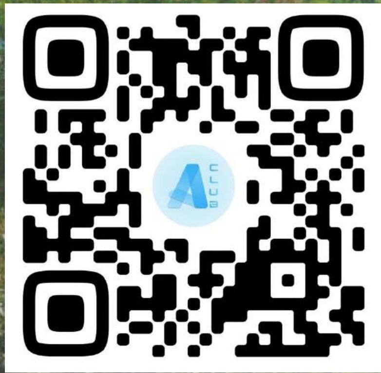
Группа абитуриентов ВШЭИБ