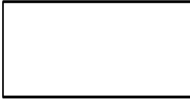
Рисунок 1 – Название рисунка

Основной текст. Основной текст. Основной текст. Основной текст. Основной текст. Основной текст. Основной текст. Основной текст. Основной текст. Основной текст. Основной текст. Основной текст. Основной текст. Основной текст. Основной текст. Основной текст. Основной текст. Основной текст. Основной текст. Основной текст. Основной текст. Основной текст. Основной текст. Основной текст. Основной текст. Основной текст. Основной текст. Основной текст. Основной текст. Основной текст. Основной текст. Основной текст. Основной текст. Основной текст. Основной текст. Основной текст. Основной текст. Основной текст. Основной текст. Основной текст. Основной текст. Основной текст. Основной текст. Основной текст. Основной текст. Основной текст. Основной текст. Основной текст. Основной текст.