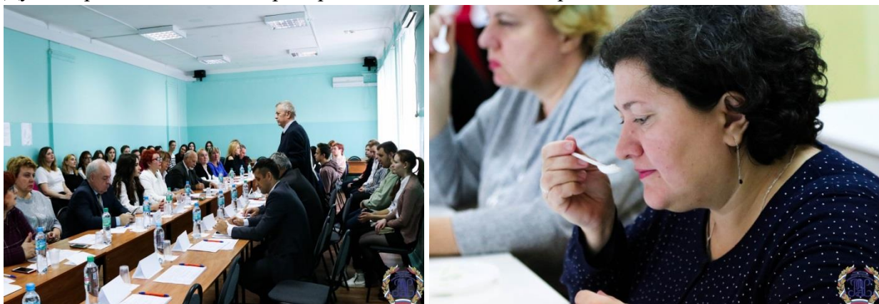
Региональная научно-практическая конференция

Ежегодно филиал становится площадкой для проведения региональных научно-практических конференций «О состоянии продуктов питания в Воронежской области» и смотров качества продукции, реализуемой в торговых сетях г. Воронежа. Организаторами конференции выступают Воронежское региональное общественное движение в защиту прав потребителей «Качество нашей жизни» и кафедра коммерции и товароведения Воронежского филиала. В работе конференции принимают участие представители научного сообщества региона, Общественной палаты Воронежской области, областной Думы, производственных предприятий, общественных организаций и СМИ.