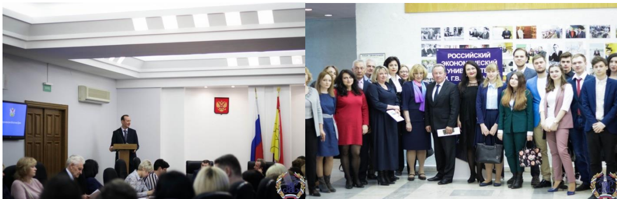
Участники Международной научно-практической конференции «Общество и экономическая мысль в XXI в.: пути развития и инновации».

Традиционно в апреле в Воронежском филиале проходит Международная научно-практическая конференция «Общество и экономическая мысль в XXI в.: пути развития и инновации».