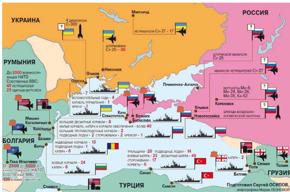
Рис. 3. Военный потенциал мировых держав и НАТО на Черном море 1

Наибольшего напряжения военно-политическая ситуация в регионе достигла в июле 2014 г., когда под предлогом проведения учений в Черном море была сосредоточена группировка из более чем двух десятков кораблей НАТО классом выше тральщика. Причем в отличие от аналогичных учений предыдущих лет учения 2014 г. были максимально приближены к территориальным водам России (рис. 3).