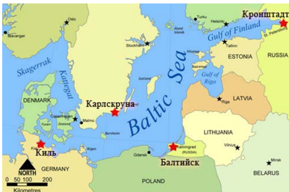
Рис. 2. Военные базы НАТО в акватории Балтийского моря 1

Таким образом, налицо скрытая закамouflированная экспансия НАТО в страны Балтии с тем, чтобы не только продемонстрировать присутствие или солидарность, но и обеспечить освоение инфраструктуры, которую можно будет использовать в военных целях. В перспективе, по всей видимости, подобная тактика «вползания» НАТО в регион будет продолжена.