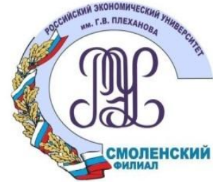
Smolensk branch of federal state educational institution of higher professional education "Plekhanov Russian University of Economics"