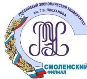
Смоленский филиал федерального государственного бюджетного образовательного учреждения высшего профессионального образования «Российский экономический университет им. Г.В. Плеханова»